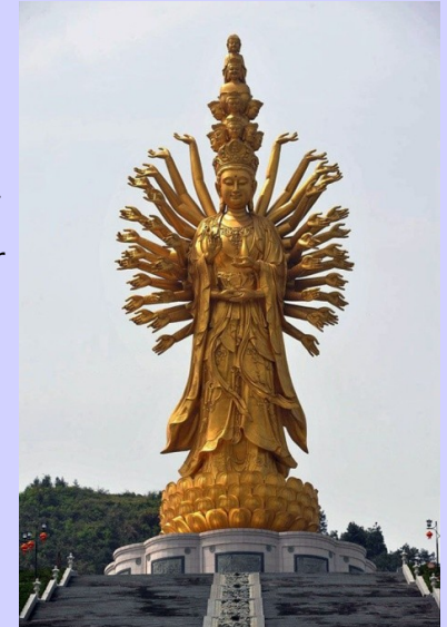
KwanYin van Weishan 99m hoog

c. De volgers van de Dharma vormen de Sangha, de gemeenschap van Boeddhisten uitgebeeld door een monnik met een bedelnap. Alle symboliek rondom de Sangha is gericht op één bepaald doel: het bereiken van het Nirwana, een staat van rust en kalmte, om definitief bevrijd te worden uit de kringloop van wedergeboorte en lijden. De leerling moet leren zich te concentreren op het volledig samengaan van de gehele symboliek van de Drie Juwelen.