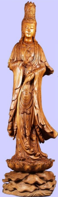
Kwan Yin met levenswater

Water staat voor 'hart, liefde en goed doen.' Zoals water overal naar toe loopt en alles doordrenkt, zo gaat dit ook met dingen, die je met je hart uit liefde doet. Water wordt vaak geofferd in een Boeddhistische tempel en in verband gebracht met de maan, de vrouwelijke voedende kracht van het heelal. Kijken naar stilstaand of stromend water kan een hulpmiddel zijn bij het mediteren. Water wordt uitgegoten over het beeld van Boeddha als gebaar van devotie en toewijding.