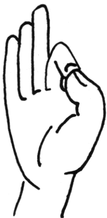
Vitarka mudra: argumentatie

Het besef van vergankelijkheid laat ons inzien, dat zowel lijden en verdriet, als ook vreugde en geluk voorbijgaan.