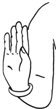
Abhaya mudra: bescherming

Het gaat niet om de omvang van onze daden, maar om de intentie van onze daden.